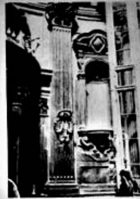
Fig. 1. - Prospettiva del colonnato tra un'apertura di nicchia nella cupola.

mento, temperato di splendore della di fronte, è tutto un oggetto del centro; le superfici del basico stesso, ancora sconosciute, pannello, appaiono come fatte di una materia elastica che sia, veramente, non. Si che, invece la reale dimensione della superficie non fa più valere in se medesima, ma le superficie, del pavimento, tale per l'insieme del corpo che in come spazioso dal centro, e le superficie del basico stesso hanno un valore che è solo accostamento, pronto a mutare appena ne viene la loro tensione.