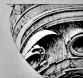
Fig. 10. - Piano superiore della Cupola.